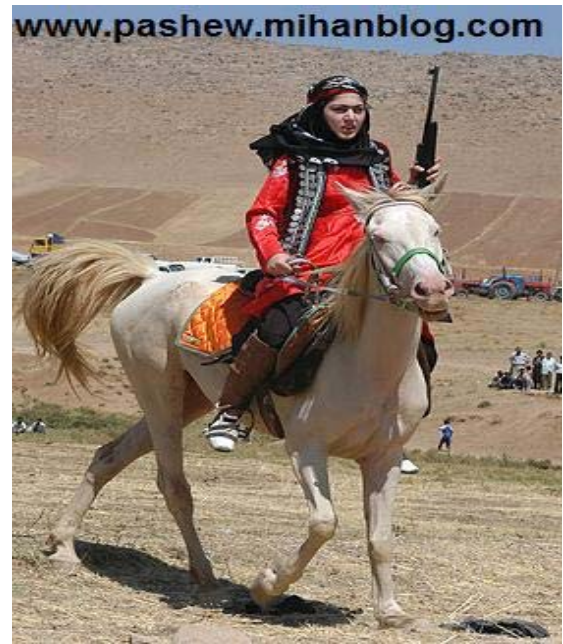
دیگر شیرزنان ایران زمین در ادامه مطلب