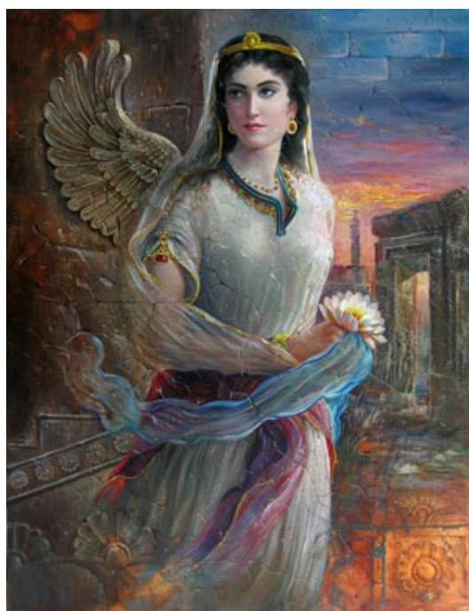
دختر اسفندیار و خواهر بهمن و ملکه نامداری از سلسله کیانیان .