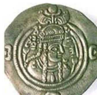
سکه شاه بانو پوران‌دخت