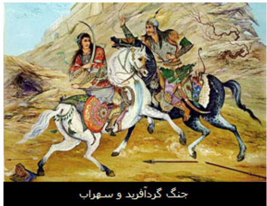
جنگ گردآفرید و سهراب