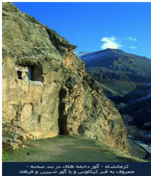
کرمانشاه - گور دخمه های در بند صحنه - معروف به قبر کیکاوس و یا گور شیرین و فرهاد

خسرو پرویز و شیرین حماسه ای از خود ساختند که همیشه در تاریخ ماندگار ماند. شیرین از خسرو چهار فرزند به نام های نستور، شهریار، فرود و مردانشه بدنیا آورد که هر چهار فرزند وی در زندان کشته شدند .