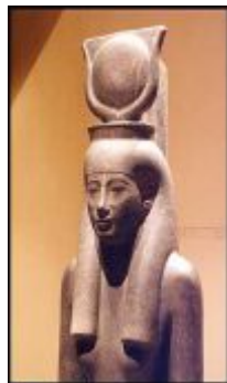
تصویر (3) تندیس الهه «هاتور» تصویر (4) تصویر برجسته الهه «هاتور»