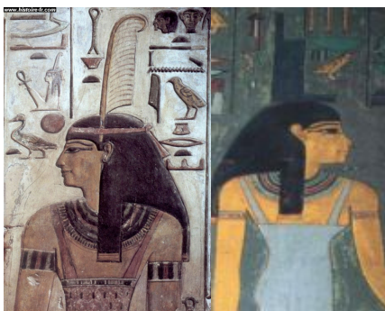
«پرعدالت» بر سرش. آرامگاه ستی اول. آفریننده جهان