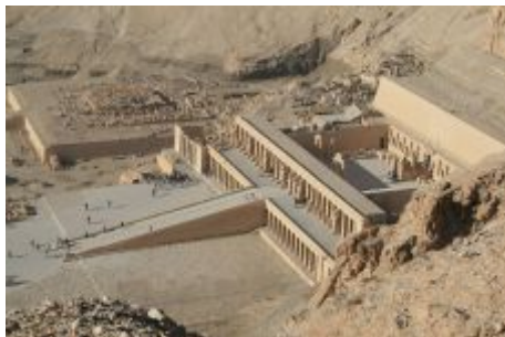
تصویر (7) پرستشگاه «دبر ال - بهاری»

کریستیان دسروش - نوبل کور می‌نویسد: «نام فرعون به معنای خانه بزرگ، نخستین بار در دوره سلطنت هت‌شپ‌سوت به کار رفت و به کاخ اطلاق می‌شد. پس از آن، این واژه برای نامیدن فرمانروای ساکن این خانه بزرگ به کار رفت؛ مفهوم واژه‌هایی مانند کاخ سفید و یا کاخ البیزه امروزی برگرفته از همین نامگذاری می‌باشند.» (دسروش - نوبل کور، 196) دوران فرمانروایی هت‌شپ‌سوت از جمله آرامترین فرمانروایی‌های مصر به شمار می‌رود.