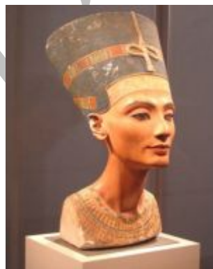
* موزه بریتیش لندن

یکی دیگر از این ملکه‌های قدرتمند، آنخسا (به معنای: دختری که برای آتون زندگی می‌کند) است: دختر سوم آخناتون و نفرتی‌تی، همسر توتانخامون معروف که آرامگاهش کاملاً دست نخورده در نهم نوامبر 1922 به دست هاوارد کارتر، مصرشناس انگلیسی، کشف و باز شد. «اسباب و اثار، پاپیروس‌ها و سنگ‌نوشته‌هایی که در این آرامگاه پیدا شدند، همگی حکایت از عشق بی حد توتانخامون به همسرش دارند و نقش کلیدی این ملکهٔ مصمم و با اراده را در ادارهٔ سرزمین به تصویر کشیده‌اند.» (گرونی، 1997: 107). روی صفحه‌ای از جنس عاج او را می‌بینیم که پیراهنی بلند و پلیسه به تن دارد و دو مار کبرای روی تاجش، که مقابل پیشانی‌اش قرار دارند، سمبل سلطۀ او بر سراسر سرزمین مصر هستند. روی پشتی اریکهٔ سلطنت، او را با چهره‌ای جافتاده‌تر می‌بینیم که تاجی شامل دو شاخ گاو ماده با خورشیدی در وسط و دو پر بلند در دو طرف به سر دارد: پرها نشانهٔ نفس ملکوتی و دو شاخ گاو ماده