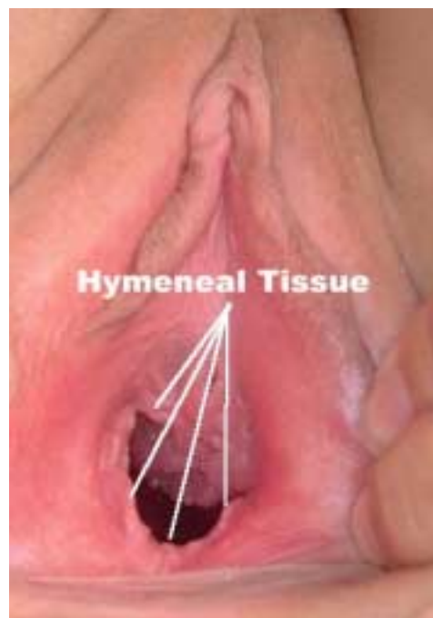
این زن اقدام به آمیزش مهبل کرده است

پرده بکارت وقتی که چیزی وارد فرج می‌شود، بطور سحرآمیزی ناپدید نمی‌شود، آن فقط بطور ناگهانی گشاد و یا پاره می‌شود تا اجازه دهد که هر چیزی وارد فرج بشود. بطور مثال، اگر یک دختر دو انگشتش را در هنگام استمناء وارد فرجش بکند، ممکن است که پرده بکارتش هم در هنگام اولین دخولش پاره بشود، بخاطر اینکه متوسط آنها بزرگتر از دو انگشت هستند. یک زن که آمیزش مهبل نیز داشته باشد ممکن است که هنوز دارای بافت‌های پرده بکارت باشد، این بافت‌های باقیمانده ممکن است باعث درد در هنگام دخول بشوند. اگر شریک فعلی یک زن دارای آلت تناسلی کلفت تری نسبت به شریک قبلی باشد، و یا اینکه زوجین سعی در انجام تکنیک جدید و یا موضع جدیدی در آمیزش مهبل بکنند، پرده بکارت ممکن است که دوباره پاره شود و یا برای اولین بار پاره بشود. زمانیکه دکترها می‌خواهند مدرکی راجع به سوء استفاده جنسی از دختران جوان بکنند، آنها جراحات وارده بر پرده بکارت را بررسی می‌کنند. باقیمانده‌های پرده بکارت ممکن است تا وقتی که یک زن یک نوزاد از فرجش به دنیا نیاورد، باقی بماند